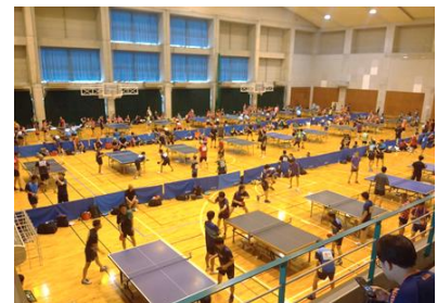
8月3日・若松体育館にて

8月3日、第43回年齢別大会が若松体育館で開催。368名（男子190名、女子178名）が参加しました。