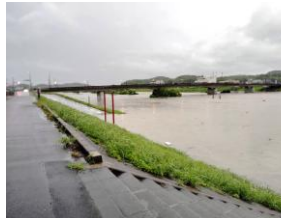
水位が上がり河川敷は水