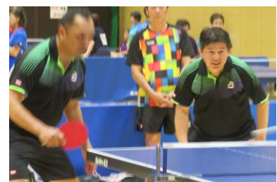
7月19日・福岡中央体育館

7月19日、福岡市中央体育館で開催。87組（男子24組、女子41組、混合22組）計174名が参加。