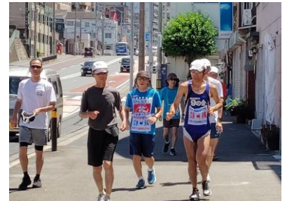
市内を走るランナー