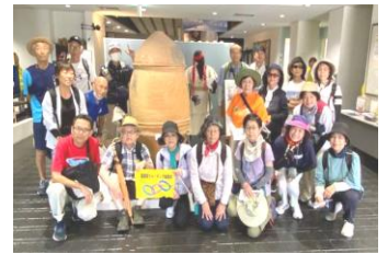
「飯塚市歴史資料館で」