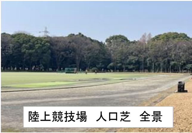
陸上競技場 人口芝 全景