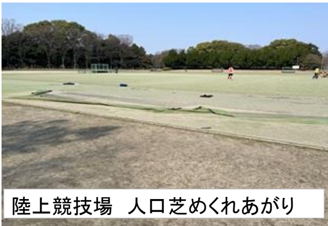
陸上競技場 人口芝めくれあがり