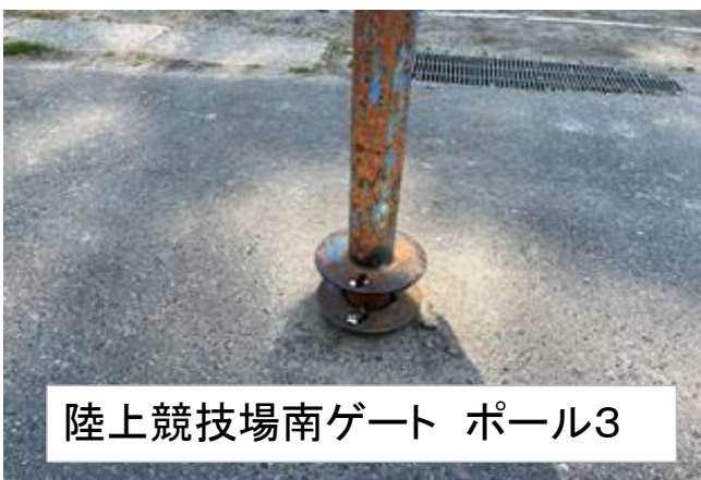
陸上競技場南ゲート ポール3