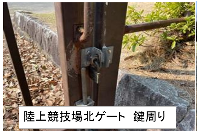
陸上競技場北ゲート 鍵周り