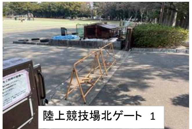
陸上競技場北ゲート 1