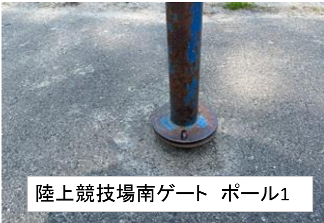
陸上競技場南ゲート ポール1