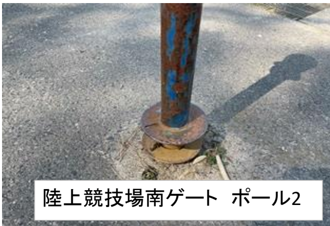
陸上競技場南ゲート ポール2