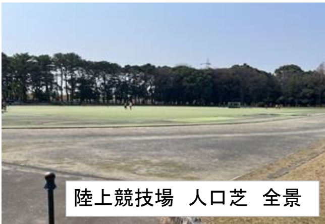
陸上競技場 人口芝 全景