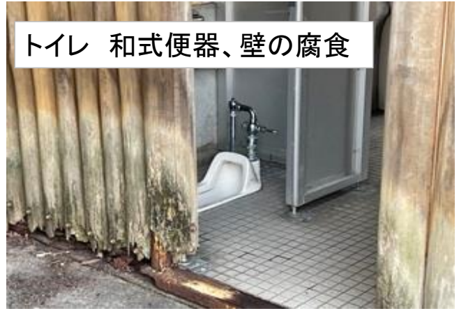
トイレ 和式便器、壁の腐食