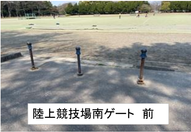
陸上競技場南ゲート 前