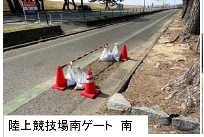
陸上競技場南ゲート 南