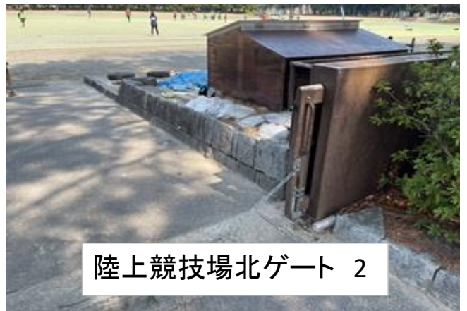
陸上競技場北ゲート 2