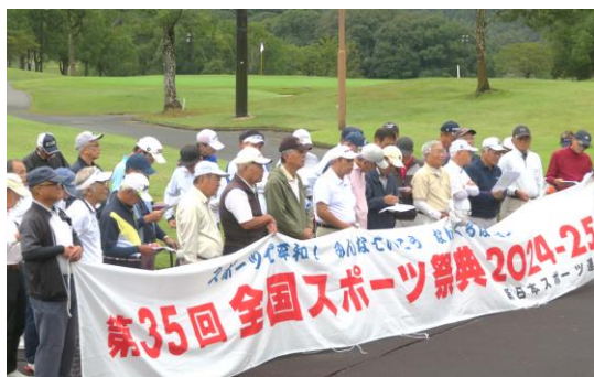
開会式での参加者

第35回全国スポーツ祭典は沖縄県を中心に福岡、宮崎の他、東京、長野、兵庫でも開催されます。福岡ではゴルフ（10月28日）ソフトボール（11月2、3日）、登山・ハイキング（11月16日）の3種目が開催されました。ソフトボールは雨で交流大会に変更しました。メインとなった沖縄県で開催されたテニスでは2種目で優勝、軟式野球と6人制バレーボールではともに準優勝を飾る成績を残したほかウォーキングも参加したメンバー全員が沖縄コースを楽しみました。参加されたチームや選手のみなさん、お疲れさまでした。全国大会で得たものを地元福岡での活動に活かされますことを願っています。