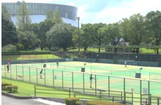
熊本会場の県総合運動公園コート