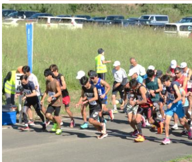
第86回月例10kmのスタート

足音に犬吠えまくるランニング 折り返しキャップのヒサシ向きを変え 回重ね仲間も増える「月例ラン」 オフシーズン「月例ラン」で刺激入れ 新顔が続々集う「月例ラン」 「月例ラン」家内も時にはお邪魔する 「月例ラン」ポカリと水のいい待遇