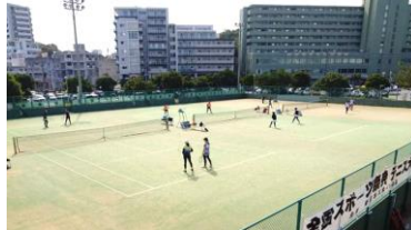
奥武山公園テニスコート