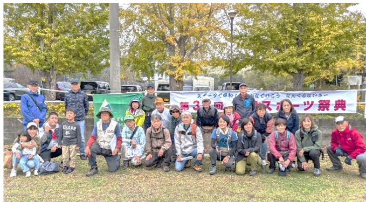
参加者全員で（平尾公民館駐車場で）

第35回全国スポーツ祭典は沖縄県を中心に福岡、宮崎の他、東京、長野、兵庫でも開催されます。福岡ではゴルフ（10月28日）ソフトボール（11月2、3日）、登山・ハイキング（11月16日）の3種目が開催されました。ソフトボールは雨で交流大会に変更しました。メインとなった沖縄県で開催されたテニスでは2種目で優勝、軟式野球と6人制バレーボールではともに準優勝を飾る成績を残したほかウォーキングも参加したメンバー全員が沖縄コースを楽しみました。参加されたチームや選手のみなさん、お疲れさまでした。全国大会で得たものを地元福岡での活動に活かされますことを願っています。