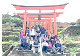
「浮羽稲荷神社の赤鳥居」