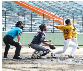
スペシャライズドの攻撃