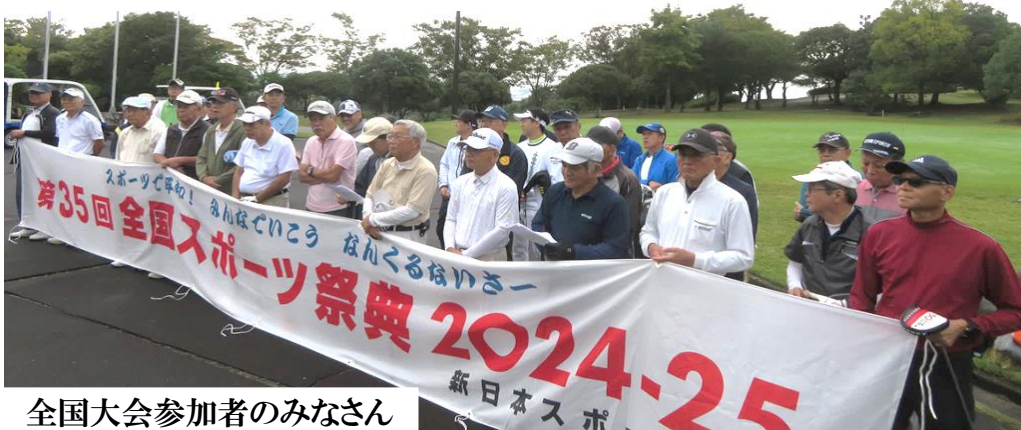
全国大会参加者のみなさん