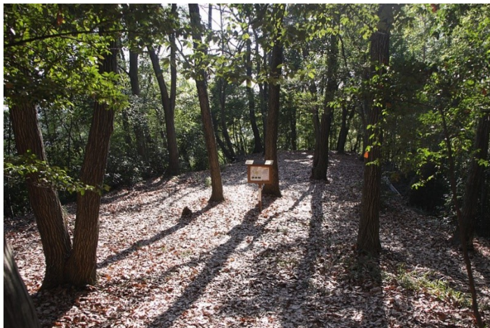
小沢城址 空堀・井戸の跡と思われる遺構等が残る

★多摩区観光ボランティアガイドによる、多摩区の魅力発見!モデルコース①を歩きます。