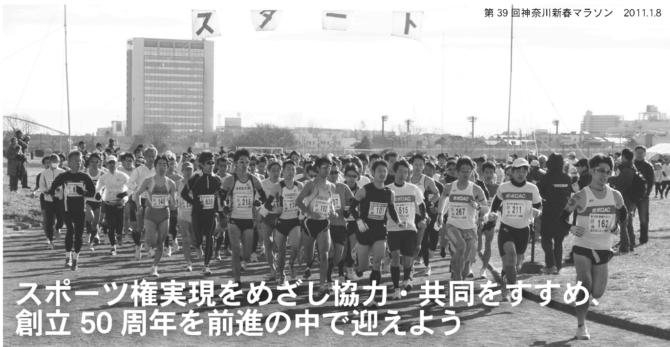
第39回神奈川新春マラソン 2011.1.8

発行 新日本スポーツ連盟 〒170-0013 東京都豊島区東池袋 2-39-2 大住ビル 402 TEL: 03-3986-5401 FAX: 03-3986-5403