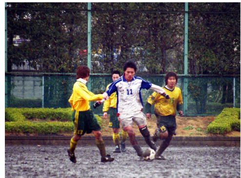
第1回神奈川フット・ア・セット大会