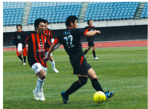
全国フット・ア・セット交流大会